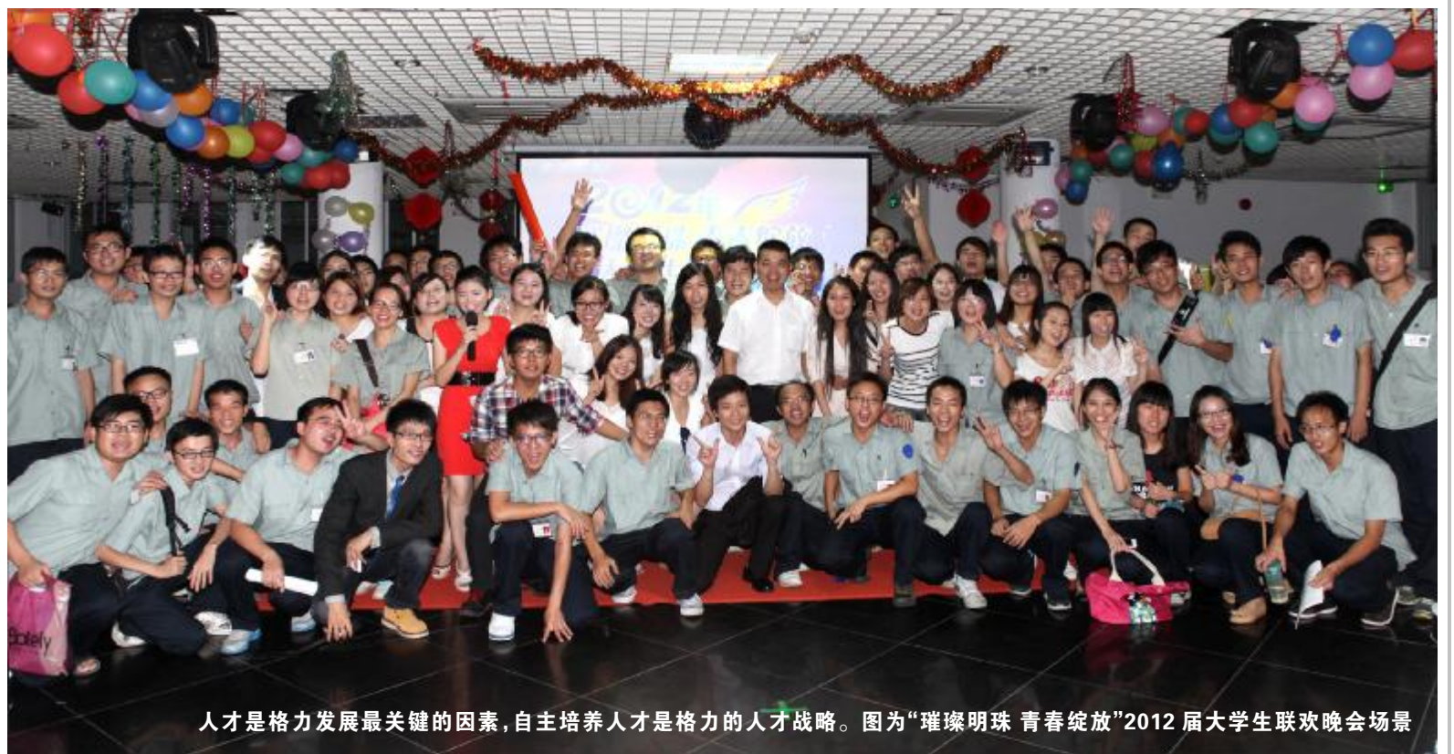
人才是格力发展最关键的因素,自主培养人才是格力的人才战略。图为“璀璨明珠 青春绽放”2012届大学生联欢晚会场景

环球企业家杂志记者陈庆春微博称,看了格力电器半年业绩报表,下半年不出意外今年冲击1000亿问题不大。