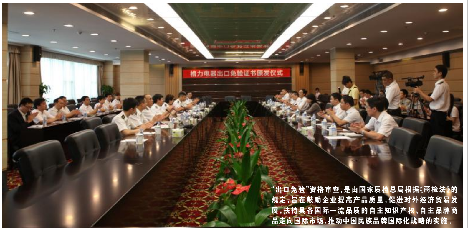
“出口免验”资格审查,是由国家质检总局根据《商检法》的规定,旨在鼓励企业提高产品质量,促进对外经济贸易发展,扶持具备国际一流品质的自主知识产权、自主品牌商品走向国际市场,推动中国民族品牌国际化战略的实施。

据统计,“出口免验”措施实施 10 多年来,全国获“出口免验”资格的企业仅 150 多家,而空调行业更是屈指可数。本次格力电器再次获得“出口免验”资格,充分展现了其卓越的产品品质及强大的质量管控实力。