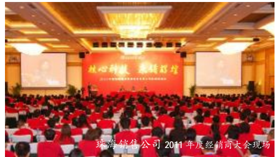
珠海销售公司 2011 年度经销商大会现场

司 2010 年成绩的同时, 对新年度的销售工作提出了新的要求。她要求格力经销商们: 加紧建设格力电器全国 4S 连锁专卖店, 多开店, 开大店, 展示更多的格力新产品。要创新管理, 用一流的产品、一流的服务赢得更多消费者; 在人才的培养上更是不能懈怠, 要有源源不断的优秀人才与格力一起创造更加辉煌的明天。