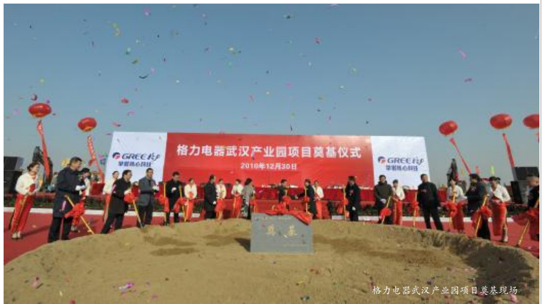
格力电器武汉产业园项目奠基现场

格力电器武汉产业园建成投产后,将为武汉增加近万个就业岗位,每年直接和间接拉动湖北省 GDP 增长超过 300 亿元。同时,格力具有自主知识产权的高新技术产品,将推动武汉家电产业的自主创新和结构调整,加快武汉家电产业千亿战略目标的实现。