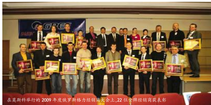
在莫斯科举行的2009年度俄罗斯格力经销商大会上,22位金牌经销商获表彰