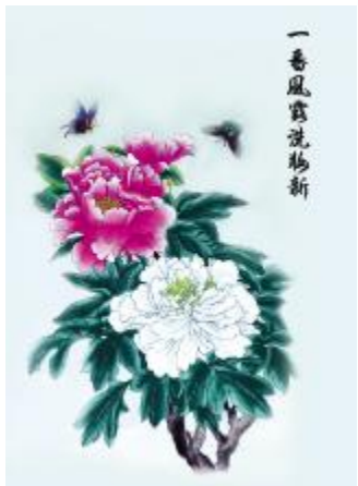
画/凯邦公司 王艳丽

夜，寂静的夜。窗外繁星点点，空荡的房间，孤独的我，坐在半遮的窗前，思绪漫飞在遥远的星空，耳旁传来许巍那