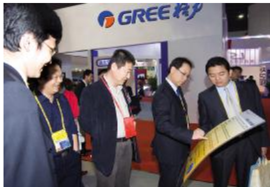
■ 江亿院士(中)正在详细了解格力产品,对格力坚持自主创新的做法和取得的成绩给予了高度评价。他指出“买产品,其实买的就是技术和品质。谁掌握了核心技术,谁就能在激烈的市场竞争中立于不败之地。”

调在-25℃的环境中正常制热。目前,格力电器科研队伍人数超过2000人,拥有技术专利2000多项,其中发明专利近300项,平均每2天推出3项专利,是中国空调业拥有技术专利最多、单项专利推出周期最短的企业。