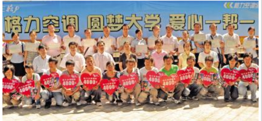
图为广西格力专卖店向 16 名贫困大学新生提供“一帮一”助学

2008 年捐助的对象主要面向河北省唐县、顺平、阜平、涞源 4 个国家级贫困县,每县资助 10 名成绩优异、品行端正、家庭困难的应届高考录取新生,每位学子资助 5000 元。