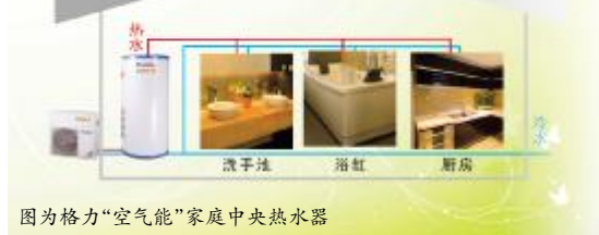
图为格力“空气能”家庭中央热水器

除了更节能,格力“空气能”家庭中央热水器直接从空气中吸收热量,不产生任何污染物;水电完全分离,从根本上杜绝了漏电、漏气、干烧等安全隐患;而且安装方便,操作简单,主机寿命可长达15年。