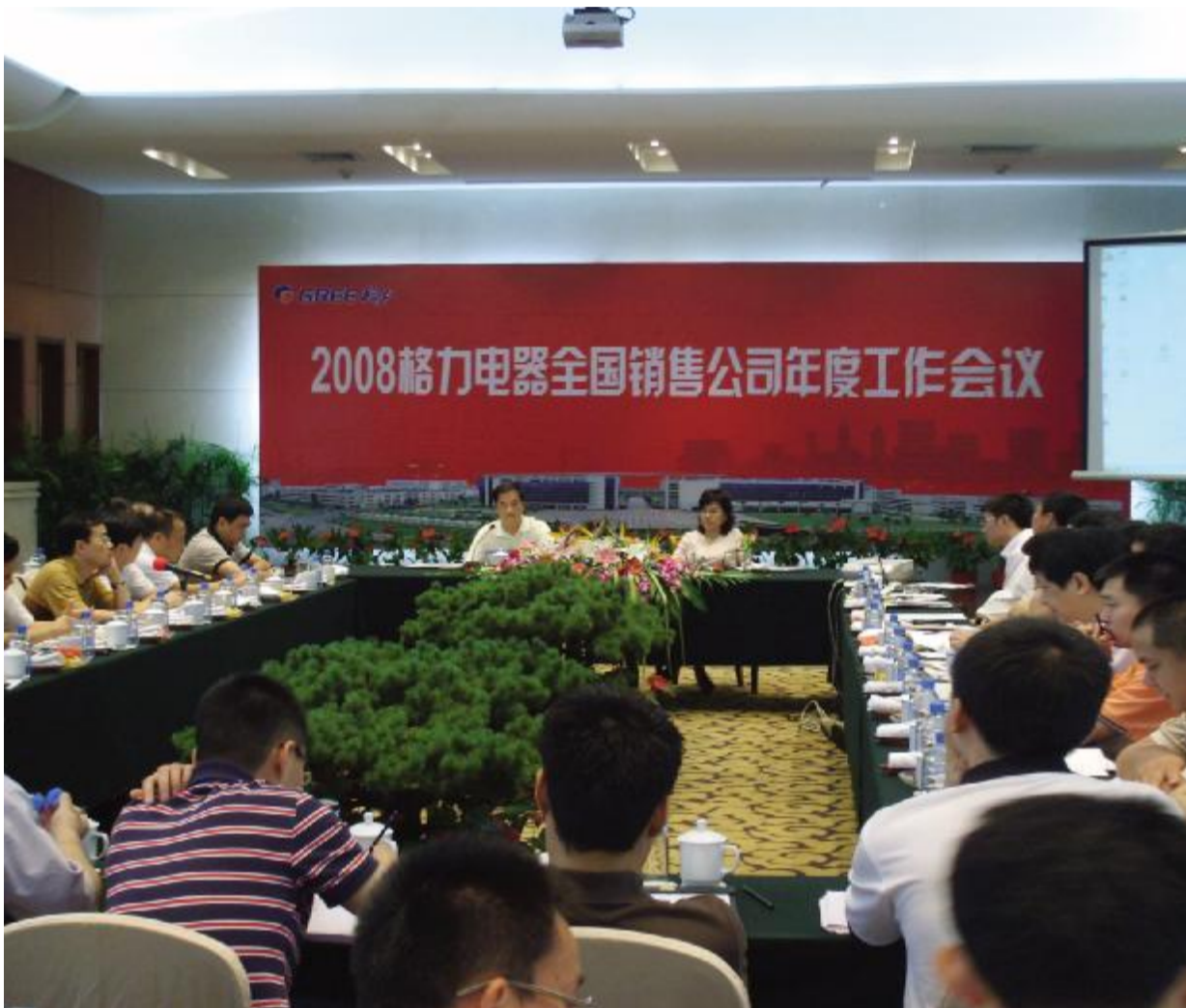
西子湖畔, 雷峰塔边, 格力电器 2008 年度全国销售会议于 8 月 9 日至 10 日在杭州举行。会议总结了 2007 年度的工作, 明确了 2008 年度的宏伟目标, 为 2008 年再创辉煌奠定了坚实的基础。(通讯员 陈拥军)