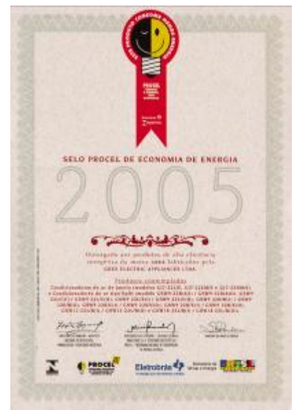
▲ 巴西政府颁发给格力电器的最高节能认证——“A级能源标签”证书。

正是由于格力空调的优良品质和领先技术,巴西政府主管机构在去年和今年的颁奖典礼上,均向格力空调颁发了“A级节能标签”证书和“节能之星”奖杯,以表彰来自中国的格力空调在巴西政府推行“节电计划过程中的卓越表现和贡献。