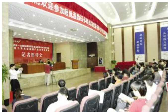
◆ 记者招待会吸引了全国众多媒体记者的目光