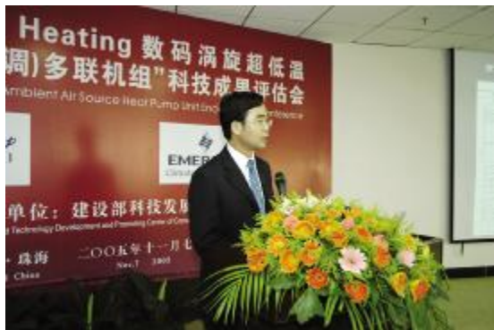
◆ 格力中央空调研发工程师向专家们做技术汇报