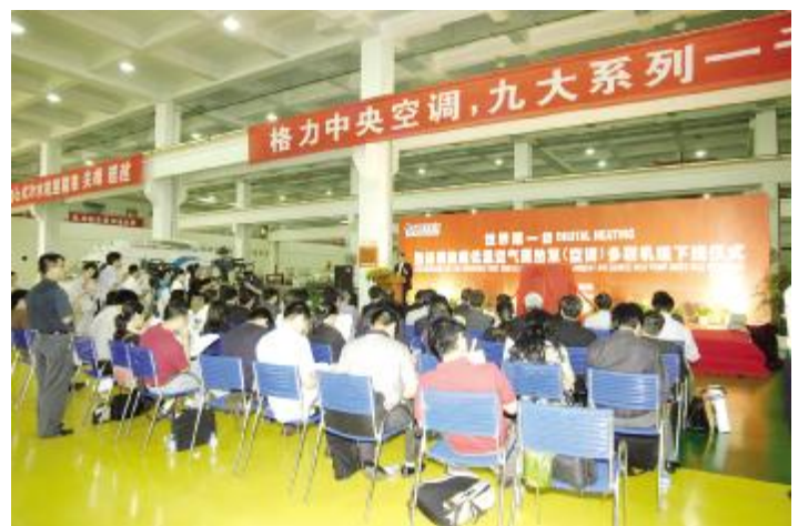
◆ 盛况空前的格力超低温数码多联机组下线仪式现场