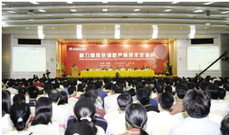
◆ 规模空前的格力商用空调新产品技术交流会在珠海国际会议中心大酒店隆重举行

会上,格力中央空调工程师向与会代表详细介绍了格力中央空调近年来在高端产品研发上的丰硕成果,全国各地建筑设计院的设计师、暖通专家还参观了格力电器拥有世界一流的中央空调生产基地和技术研发中心。他们纷纷表示,此次珠海之行,亲眼见证了格力中央空调的强大研发实力,这让他们感到很自豪,今后在设计过程中,他们将更多地使用格力中央空调这样的国产品牌。