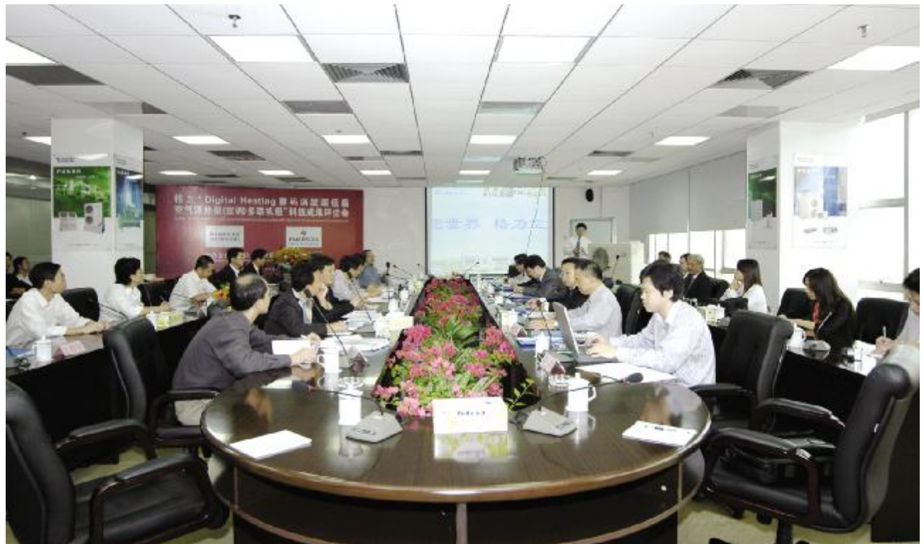
◆ 格力“Digital Heating 数码涡旋超低温空气源热泵(空调)多联机组”科技成果评估会在格力电器隆重举行