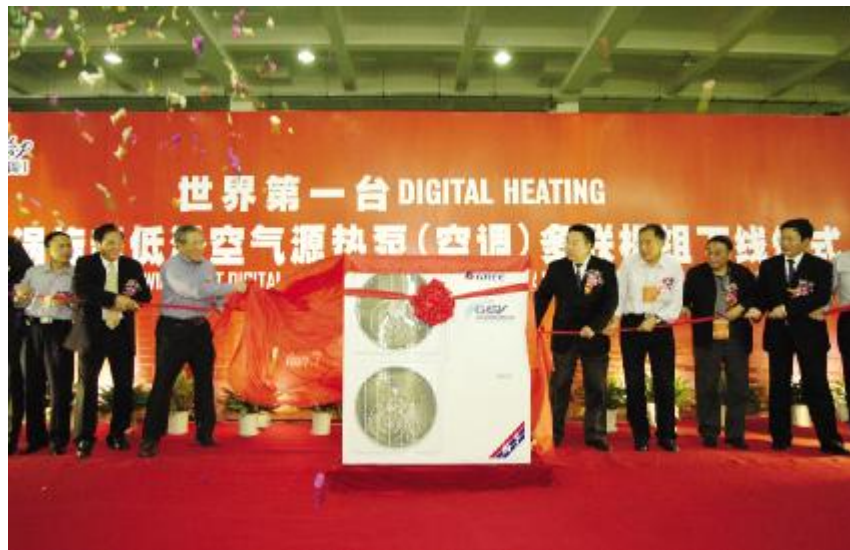
◆ 建设部、能源标准委等有关领导及评估委员会专家们共同揭开格力超低温数码多联机组的神秘面纱